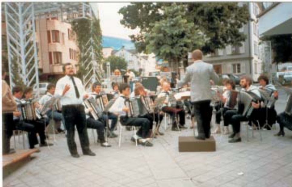
Eines von vielen Platzkonzerten...