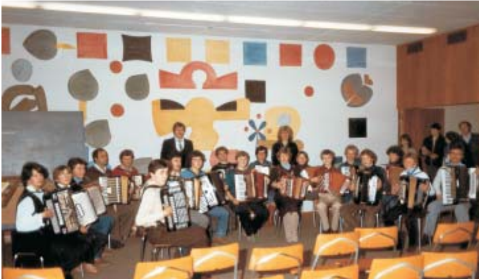
1983 war alles kleiner. Die Bühne, der Saal und viele Mitglieder...